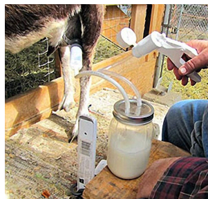
Henry Goat Milking Kit

Según la Oficina de Estadísticas Laborales de EE.UU., el CTS es responsable de casi el 30% de las lesiones por movimientos repetitivos en cualquier lugar de trabajo. Esto es probablemente mayor en los lugares de trabajo agrícola porque las horas son largas y con movimientos repetitivos. Para ayudar a los trabajadores agrícolas y agricultores a seguir