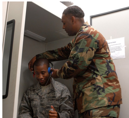
Examen de audición.

California AgrAbility ha ayudado a los trabajadores agrícolas a obtener audífonos adecuados para ayudarles a trabajar de manera segura.